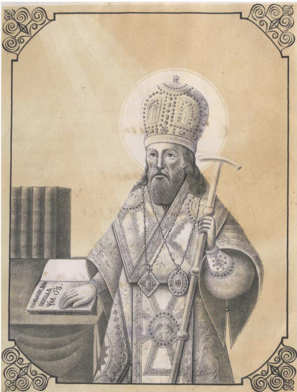
Св. Димитрій Митрополитъ Ростовскій чудотворецъ.